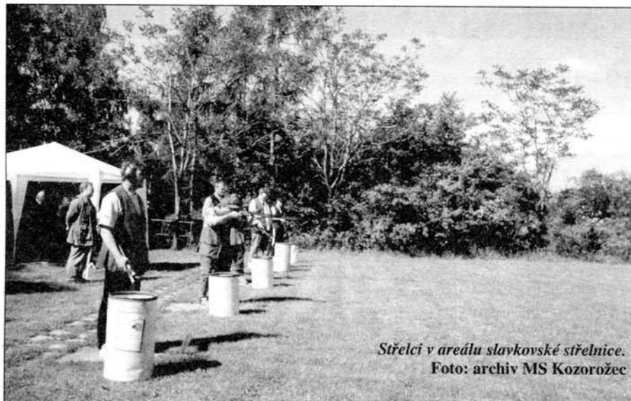
Střelci v areálu slavkovské střelnice.