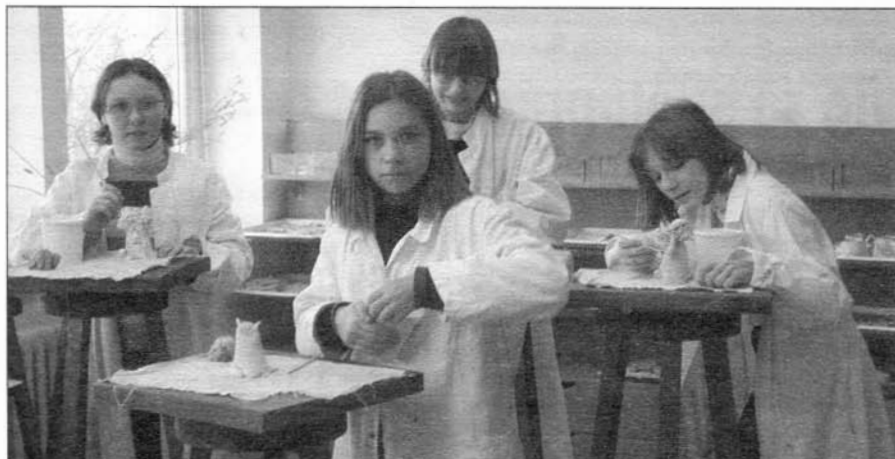
Žáci ZŠ Komenského pronikají do tajů výroby keramiky.

Na požádání zašleme harmonogram vydávání Zpravodaje a ceník inzerce.