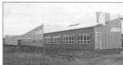
Dokončená výstavba areálu s vlajkou EU