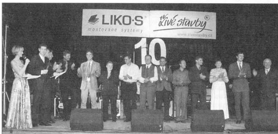
Oceňování pracovníků, kteří jsou ve firmě od začátku