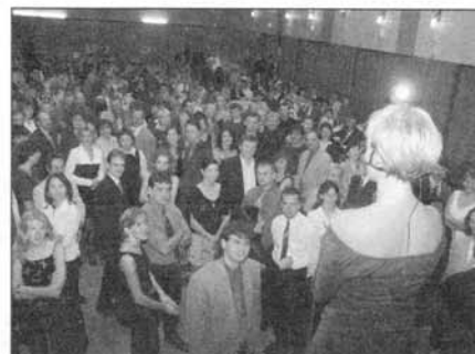
Pohled z pódia do sálu