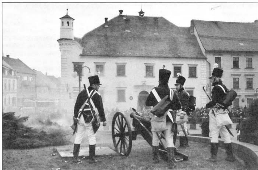
Palebné postavení děl u zámku.