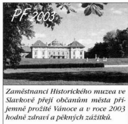
Zaměstnanci Historického muzea ve Slavkově přejí občanům města přjemně prožít Vánoce a v roce 2003 hodně zdraví a pěkných zážitků.

Byl to zdařilý průběh zájmovou činností žáků naší školy. Počet kroužků se stále rozrůstá, stoupá počet dětí, které umí pěkně vyplnit svůj volný čas. Proto se těšíme na další setkání s vámi, slavkovskou veřejností, v příštím roce. Mgr. Iva Kočí