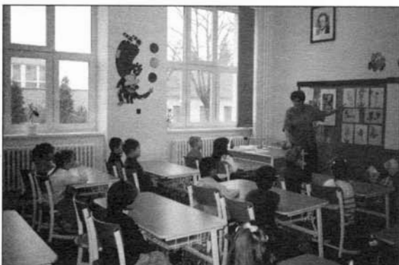
Budoucí prvňáci před zápisem v ZŠ Tyršova.