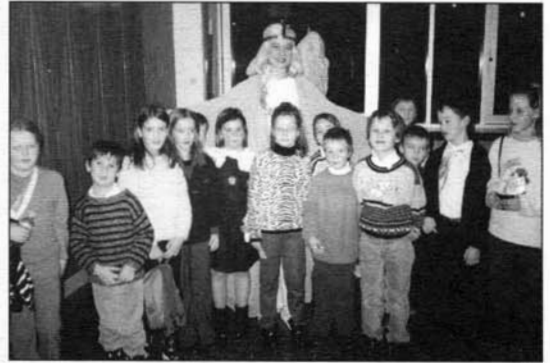
Společné foto dětí s andělem.

To, že se líbila dětem i jejich rodičům, není