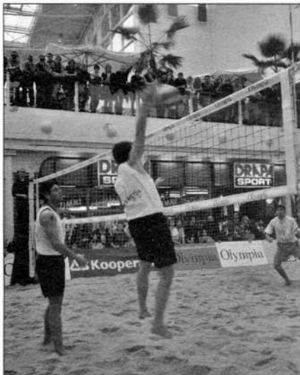
Atmosféra při loňském turnaji byla velmi příjemná.

Monilióza peckovin škodí již v období kvetení především na meruňkách, višních a třešních.