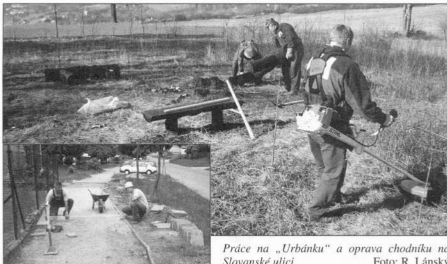
Práce na „Urbánku“ a oprava chodníku na Slovanské ulici.