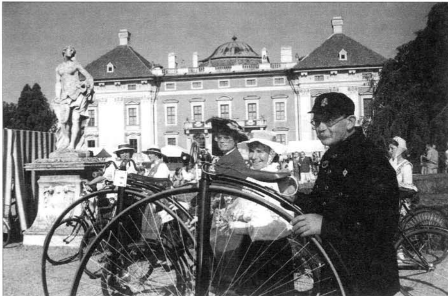
Historická kola budeme moci obdivovat v ulicích Slavkova 9. června.