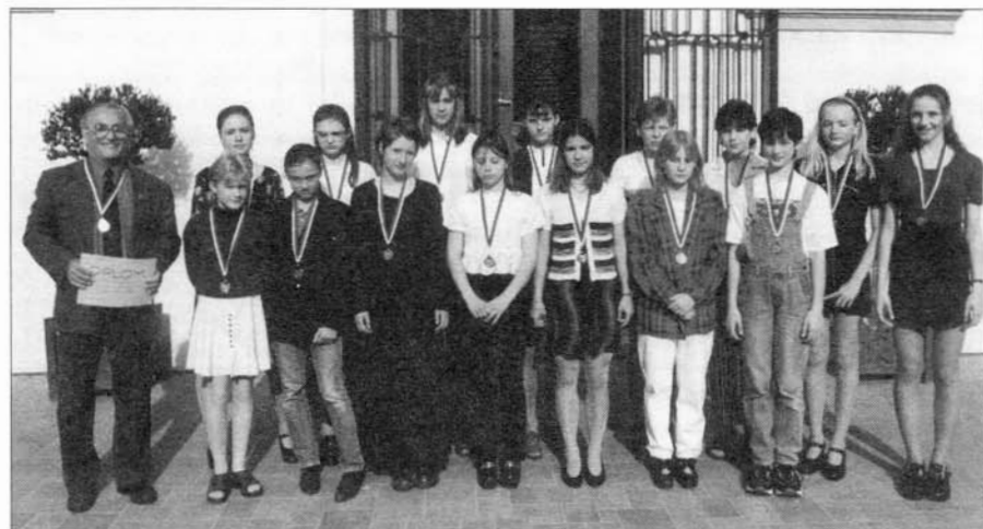
Družstvo úspěšných basketbalistek se svým trenérem.