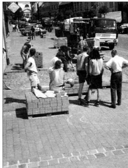
Předlažďování náměstí.