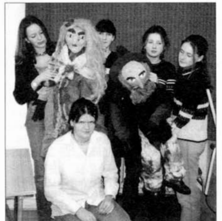
Oceněné žákyně se svými výtvy.

9.30 Průvod stárků od radnice ke kostelu 10.00 Mše svatá v chrámu Vzkříšení Páně 13.00 Průvod stárků městem, doprovází Zámecká kapela 20.00 Krojovaná hodová zábava v sálech Kulturního domu, hraje Stříbrňanka