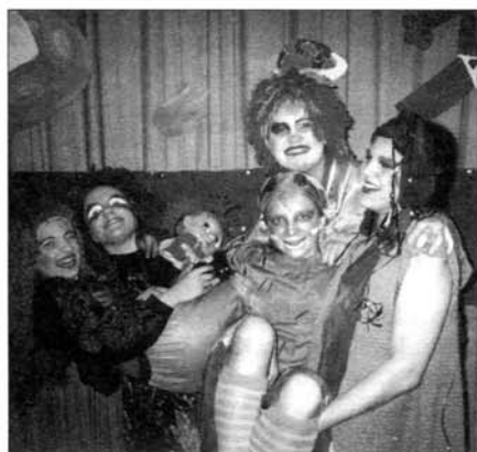
Žáci ZŠ Komenského zahráli sci-fi pohádku Směr Jupiter.