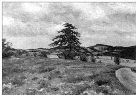
Jeden z obrazů malířky Heleny Puchýřové

Start závodu na 100 mil bude v 5 hodin v Brně, všechny ostatní kategorie startují v 9 hodin před slavkovskou radnicí a budou v průběhu dne projíždět trasu: Palackého náměstí, Čs. armády, Vážany n. Litavou, Hrušky, Šaratice, křížovatka Otice, Újezd u Brna, Mohyla míru a zpět po stejné trase, ve Slavkově po ulici Čs. armády, B. Němcové, Lidické, Husově na Palackého náměstí.