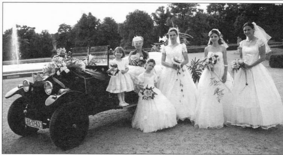
Těmito snímky se ještě vracíme k výstavě Svatba na zámku, která se konala od 23. května.