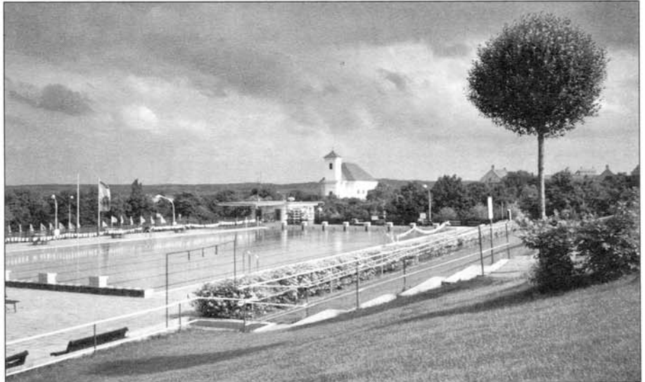
Třpytivá voda, překrásné okolí, čistota a upravené trávníky – to je slavkovské koupaliště.

Galerie O. K. je přístupná denně od 9 do 17 hodin. HM