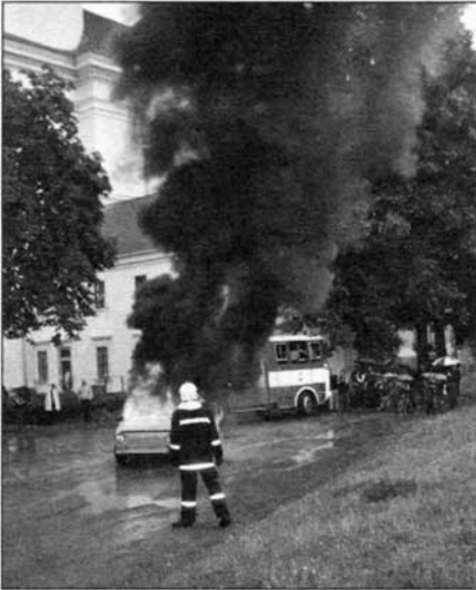
Likvidace požáru auta v podání slavkovských dobrovolných hasičů.