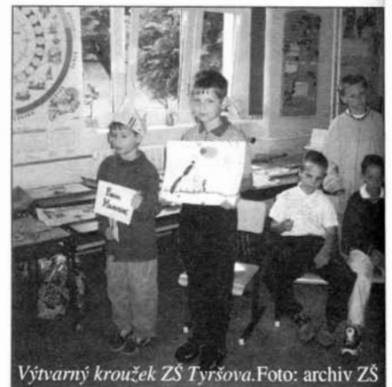
Výtvarný kroužek ZŠ Tyršova.