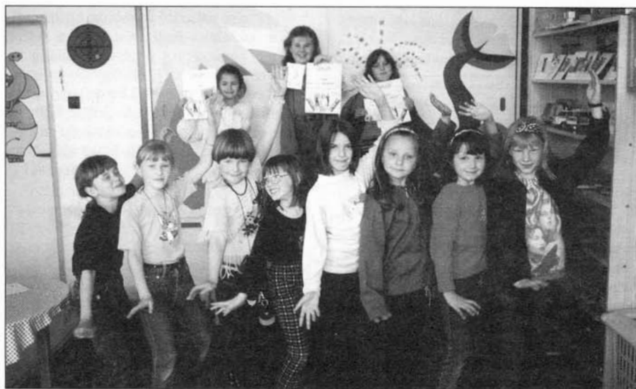
Malé tanečnice ze ZŠ Komenského sklídily zasloužený úspěch.