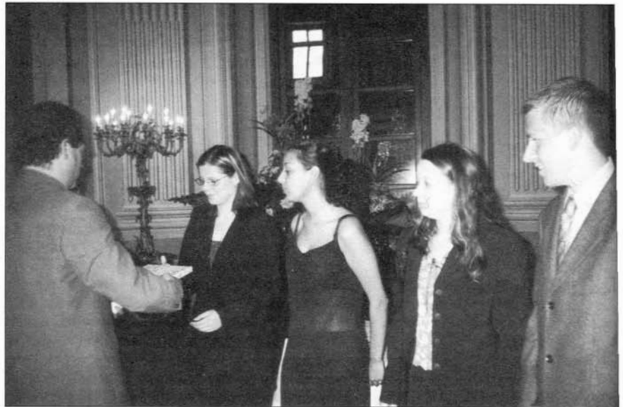
Předání maturitních vysvědčení studentům ISŠ Slavkov u Brna.