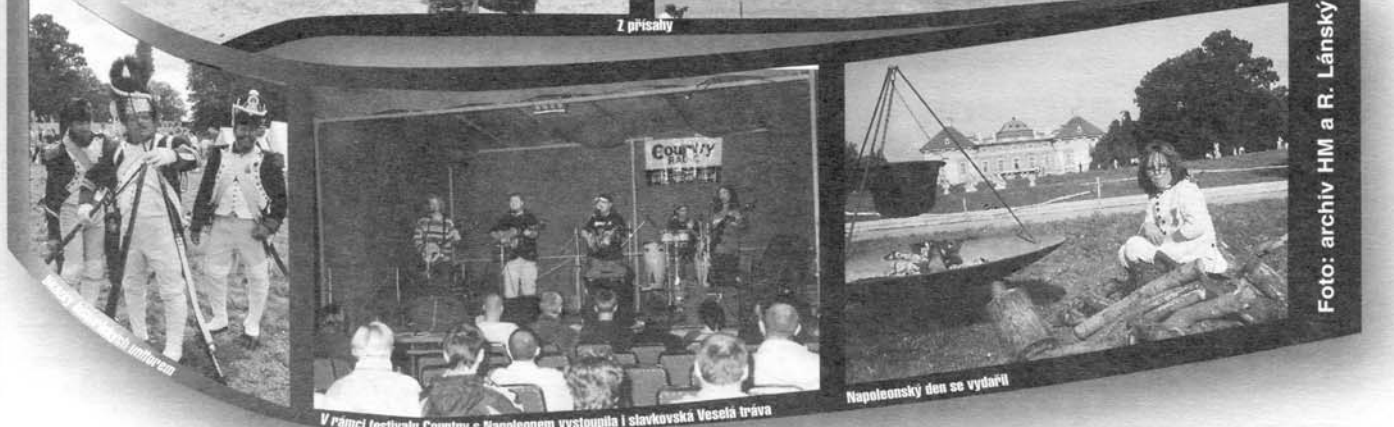
V rámci festivalu Country s Napoleonem vystoupila i slavkovská Veselá tráva