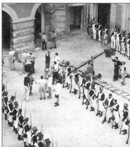
Z natáčení televizního seriálu Napoleon.

Skauting je celosvětové hnutí. V současnosti jej tvoří asi 35 milionů zejména mladých lidí z více než dvou set států a teritorií... Ve Slavkově