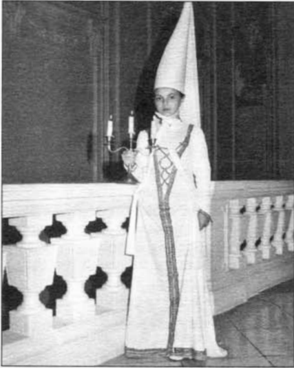
Slavkovská Bílá paní.