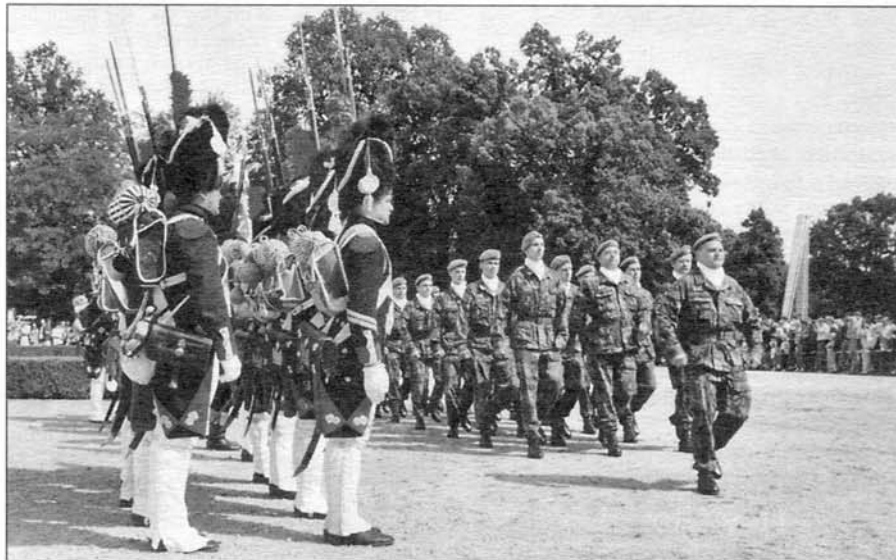
Pod bedlivým dohledem příslušníků Slavkovské gardy defilovali jejich „kolegové ve zbrani“, nováčci ze 74. záchranné a výcvikové základny v Bučovicích.

V prvním patře severního křídla zámku se koná dlouhodobá výstava Napoleonské války a české země. Galerie OK – 7. 9. Vernisáž výstavy - výtvarníci Josef Hořava a Karel Cyril Votýpka. Galerie HOLLAR – 4. 8.–30. 9. Karel Zeman - grafiky a medaile. HM