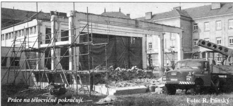
Práce na tělocvičně pokračují.

V sále městského kulturního střediska se dne 19. září uskutečnil pořad pro děti „S Kamarády za pokladem“. Je určen pro děti mateřských škol a první stupeň základních škol. Uspořádána budou dvě vystoupení - v 8.30 a v 10 hod. HM