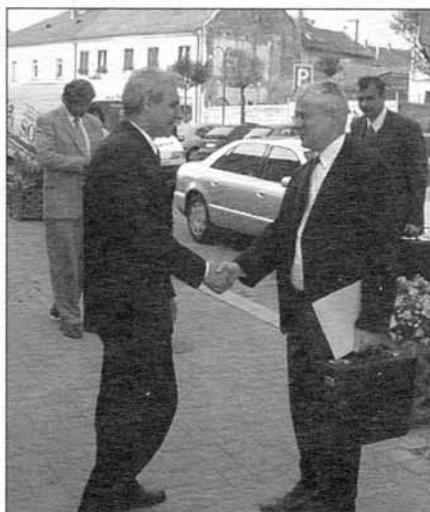
Starosta města Petr Kostík vítá místopředsedu vlády Vladimíra Špidlu. Vpravo vzadu přichází ministr Jaroslav Tvrdík.

Obrazovou reportáž z Napoleonského dne přinášíme na straně 10.