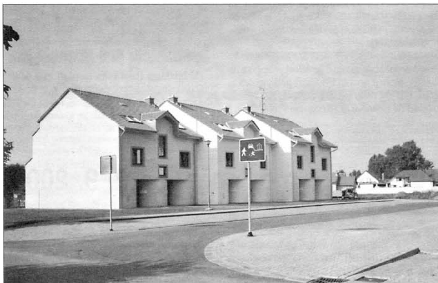
Novotou září tři bytové domy na Litavské ulici.