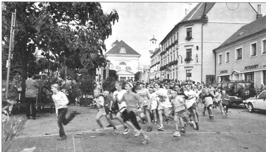
Krátko po startu Běhu Terryho Foxe na slavkovském náměstí.