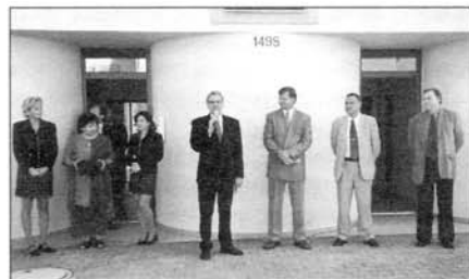
Starosta města slavnostně předává nové byty do užívání.

V sobotu dne 14. září bylo našim občanům slavnostně předáno 18 nově postavených nájemních bytů v ulici Litavská v sídlišti Polní.