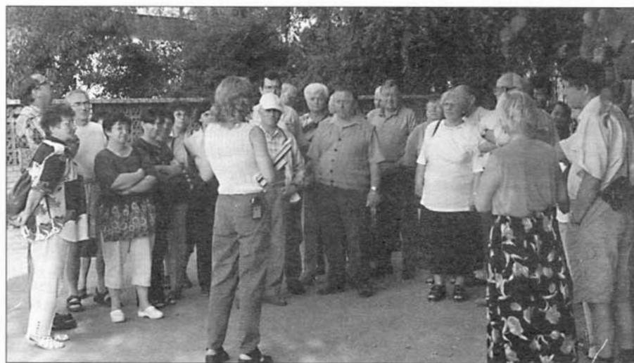
Účastníci zahrádkářského zájezdu sledují výklad průvodkyně.

ného zámku v Lednici, skleniku se subtropickými rostlinami a akvária s mořskými rybami. Po procházce k minaretu, jsme ještě zhlédli ukázky lovu dravců a závody chrtů. Odpoledne jsme se přemístili do Mikulova, kde jsme si prohlédli Ditrichštejnskou hrobku. Z její věže je výhled na tři dominanty Mikulova: zámek, Kozi hrádek a Svátý kopeček. Další zastávkou byla Klentnice. Po výstupu na Sirotečí hrádek je krásný výhled na Novomlýnská jezera a Pálavu. Zájezd byl zakončen v soukromém sklípku v Dolních Dunajovicích večeří s povídáním o víně a ochutnáváním tamních kvalitních vín. Při návratu domů jsme již naplánovali další zájezd pro příští rok. Zahrádkáři