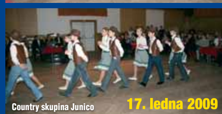
Country skupina Junico