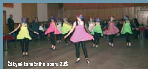
Žákyně tanečního oboru ZUŠ