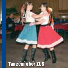
Taneční obor ZUŠ