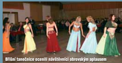
Bříšňi tanečnice ocenili návštěvníci obrovským aplausem