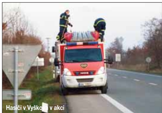
Hasiči v Vyškově v akci