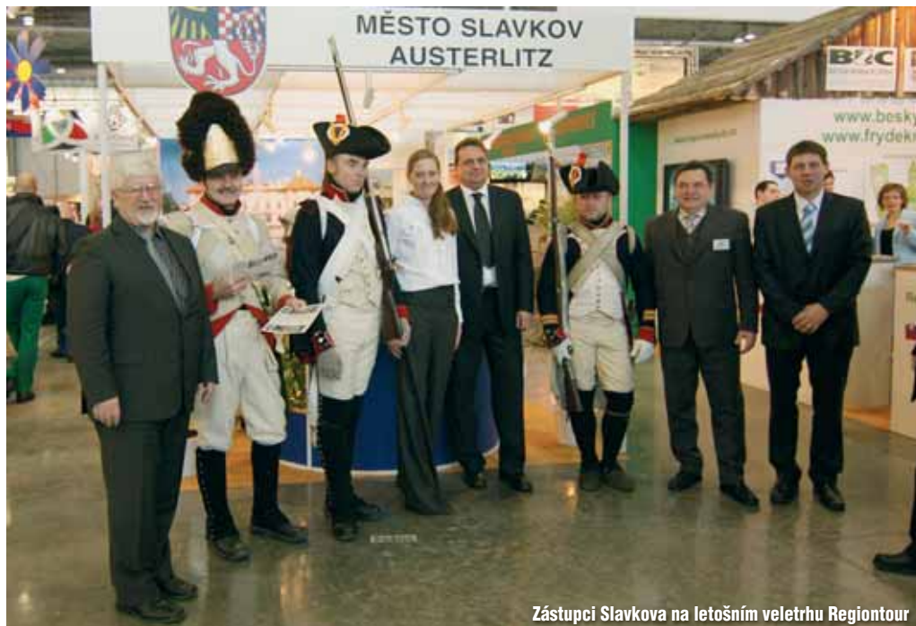
Zástupci Slavkova na letošním veletrhu Regiontour