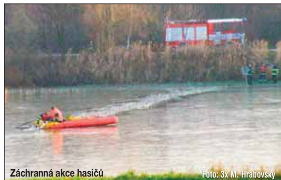
Záchranná akce hasičů