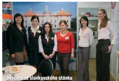
Děvčata ze slavkovského stánku