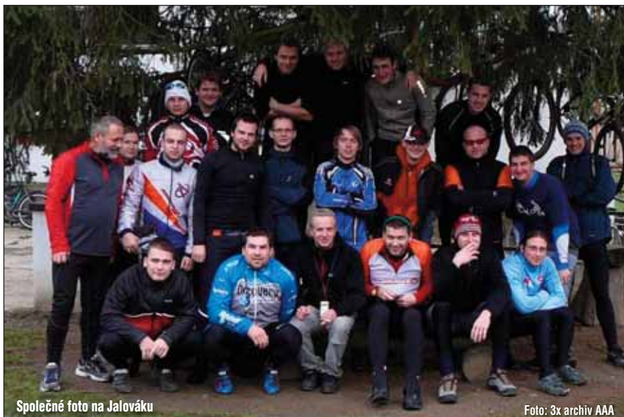
Společné foto na Jalováku