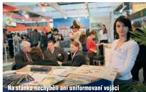
Na stánku nechyběli ani uniformovaní vojáci