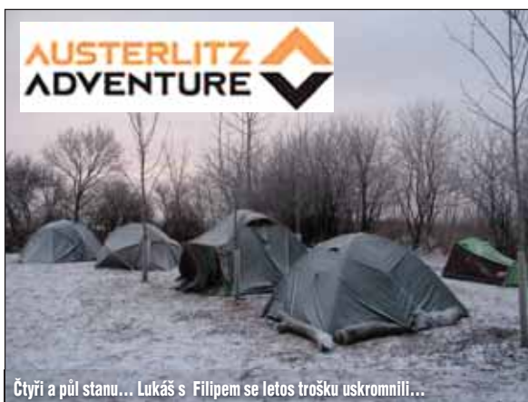
Čtyři a půl stanu... Lukáš s Filipem se letos trochu uskromnili...