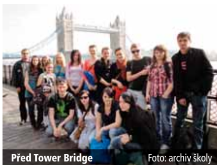
Před Tower Bridge

První den jsme společně přešli přes německé hranice až do francouzského přístavu Calais. Poté jsme se přepravili tunelem přes kanál La Manche až do Londýna. Druhý den naše skupina absolvovala prohlídku s velmi sympatickou slečnou průvodkyní. Bylo znát, že své práci rozumí a že je připravena odpovědět na všechny naše dotazy. Navštívili jsme spoustu krásných a proslulých míst, na která jen tak někdo nezapomene. Například Westminster Abbey, což je Westminsterské opatství, kde byli korunováni všichni angličtí panovníci. Buckingham Palace, neboli Buckinghamský palác, který je sídlem královny Alžběty II. Dále také National Gallery (Národní galerie), která patří k nejvýznamnějším obrazárnám na světě. Po náročném dnu se nám konečně dostalo zaslouženého odpočinku a my se mohli ubytovat v rodinách, kam se každý jistě těšil. V nastávajících dnech bylo možno navštívit Hyde Park – jeden z největších parků v Londýně, Leeds Kastle – hrad, Stonehenge – kamenný pre-