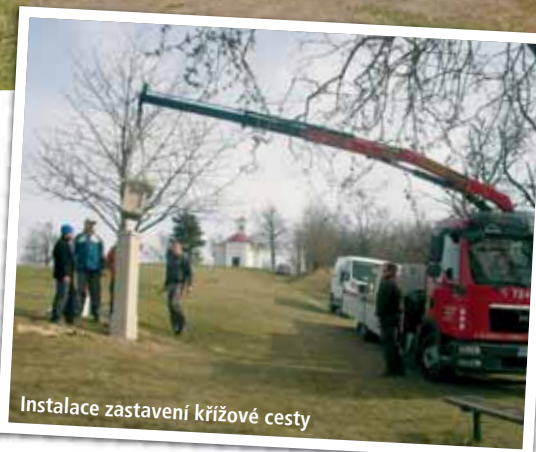
Instalace zastavení křížové cesty

V současné době pokračují práce na dokončení