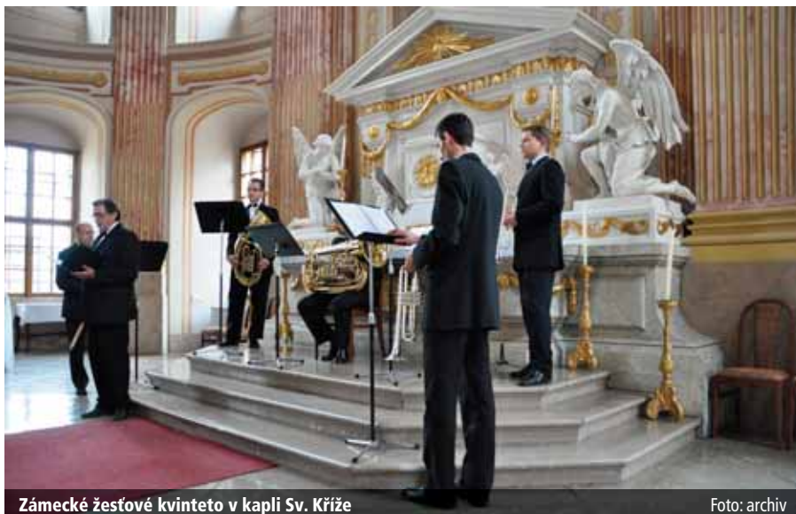
Zámecké žesťové kvinteto v kapli Sv. Kříže