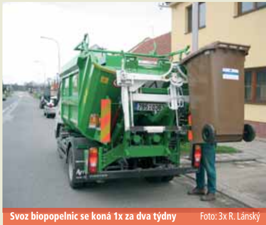
Svoz biopopelnic se koná 1x za dva týdny