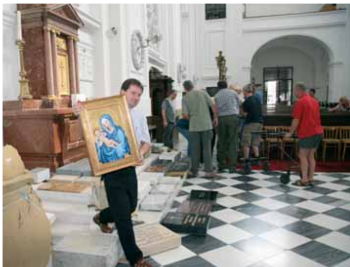
Před návštěvou papeže Benedikta XVI.