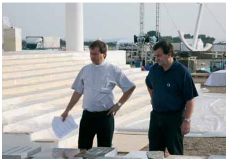
Na tuňanském letišti před žehněním kamenů papežem