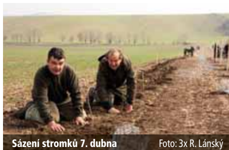
Sázení stromků 7. dubna