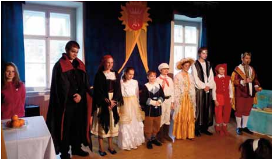
Představení Princezna ryba