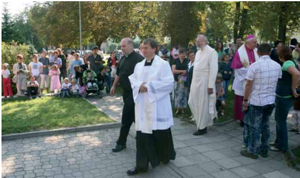
Slavnostní otevření Křesťanské mateřské školy Karolinka

Momentálně neplánuji nic, snažíme se všechno dotáhnout do konce. Přes zimu jsme ve farnosti uskutečnili velkou duchovní obnovu. Nyní tedy chci využít toho, co jsme už vybudovali a zavedli. Nechci spěchat stále někam dál, k něčemu novému. Chtěl bych využít toho, co máme, a orientovat se na prohloubení osobní víry vztahů mezi lidmi ve farnosti. Je důležité neztratit vnitřní osobní víru. Farnost nestojí na aktivitách, ale na tom, nakolik jsou lidé v ní opravdu věřící. Přemýšlím nyní jen o jednom projektu, a tím je uspořádání sborníku o farnosti – o její