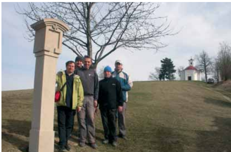
Při instalaci křížové cesty na Urbánek