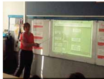
Prezentace pro rodiče

Jaké budou celkové výsledky, ukáže opět kontrolní měření držení těla , které bude pro-