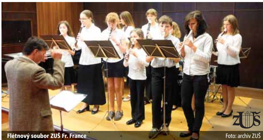
Flétnový soubor ZUŠ Fr. France