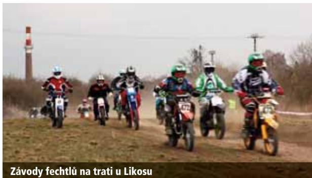
Závody fechtlů na trati u Likosu