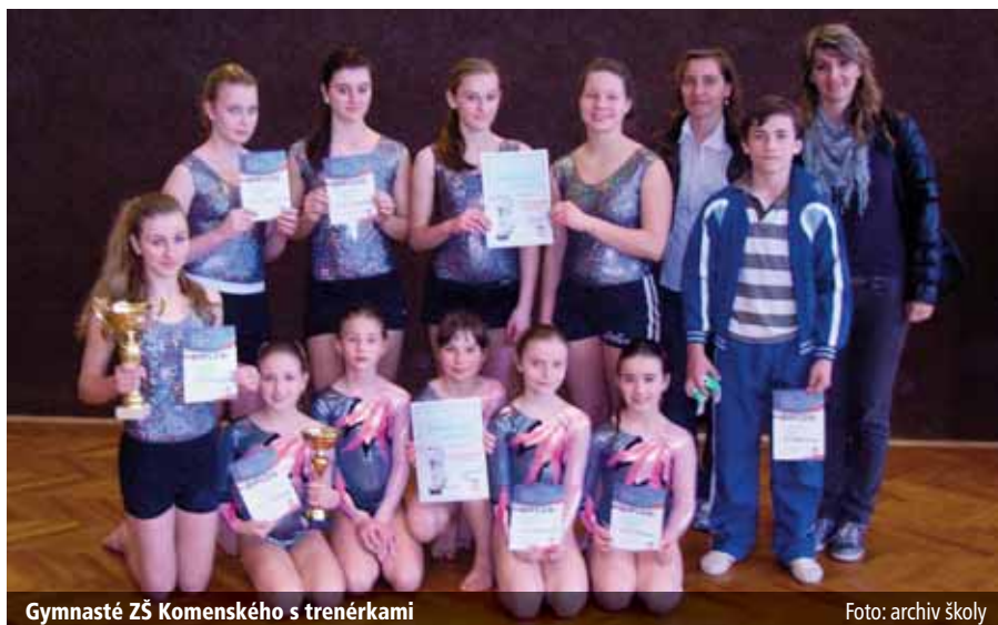
Gymnasté ZŠ Komenského s trenérkami