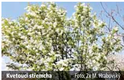
Kvetoucí střešča

Sepětí stromů s lidmi a jejich osudy zachytilo nejen mnoho básníků, také historie starých lidských civilizací. Před námi i Keltové, kteří používali měsíční cyklus, měli 13 měsíců po