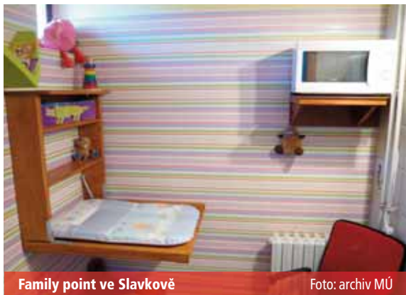
Family point ve Slavkově