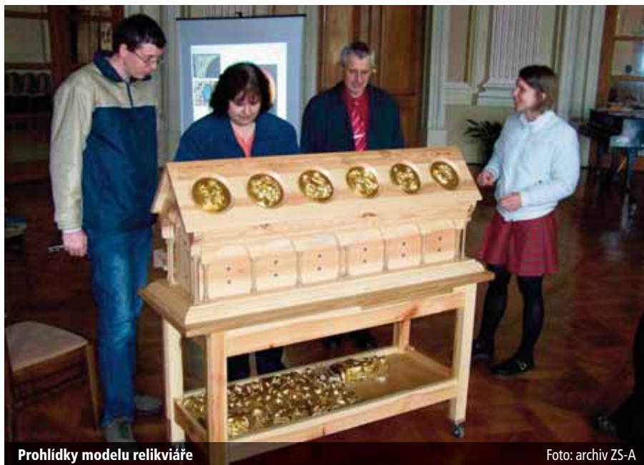
Prohlídka modelu relikviáře