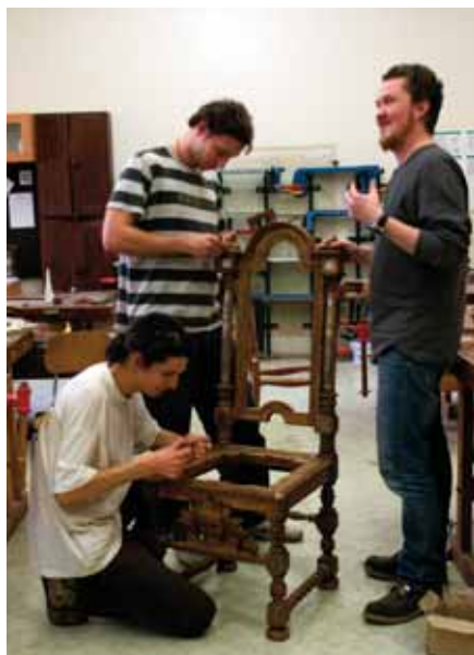
Studenti se svým pedagogem při práci