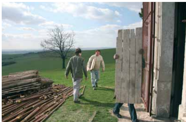
Slavkovský farář při práci opravě Urbánku