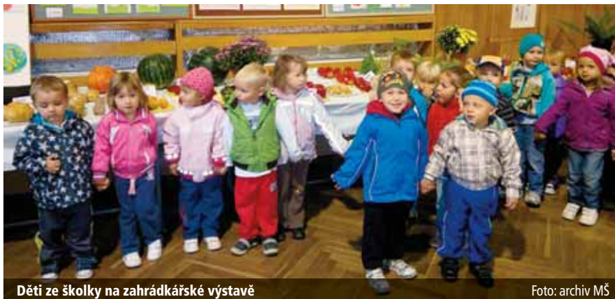
Děti ze školky na zahrádkářské výstavě

Účinkují absolventi hudebního oboru, kteří v tomto školním roce završí studium v ZUŠ ve hře na trubku, housle, příčnou flétnu, saxofon, kytaru, klavír a zpěvu.