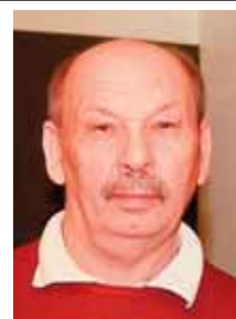
Oddíl TTC Komořany