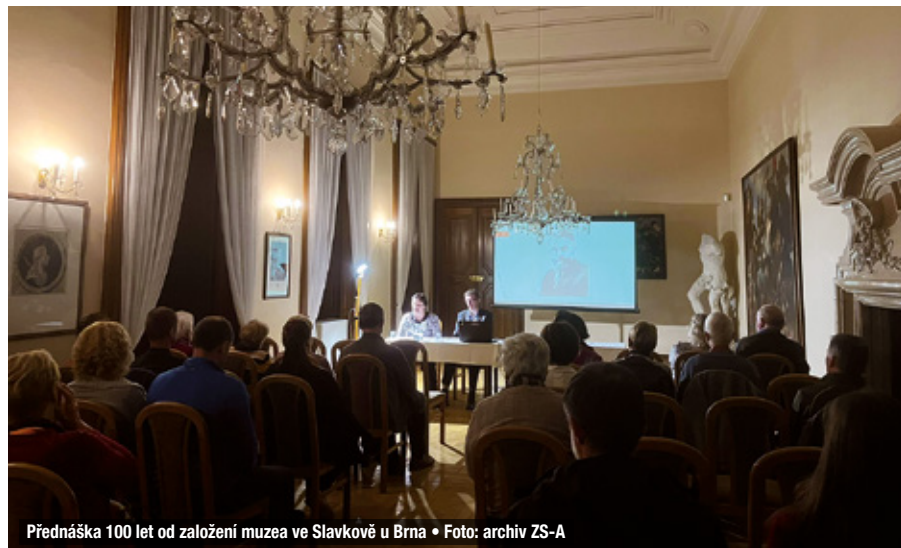
Přednáška 100 let od založení muzea ve Slavkově u Brna