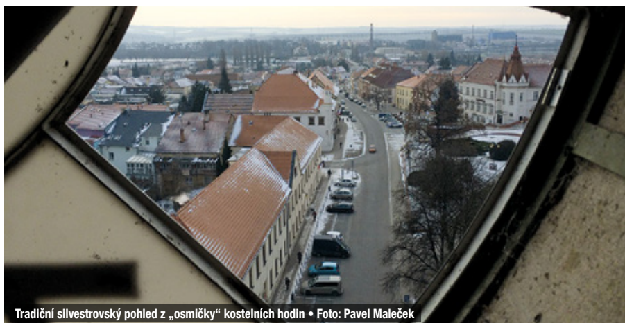
Tradiční silvestrovský pohled z „osmičky“ kostelních hodin