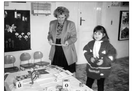
Foto z loňského zápisu na ZŠ Komenského

O dalším postupu prací v oboře budete na stránkách Slavkovského zpravodaje pravidelně informováni. (vk)