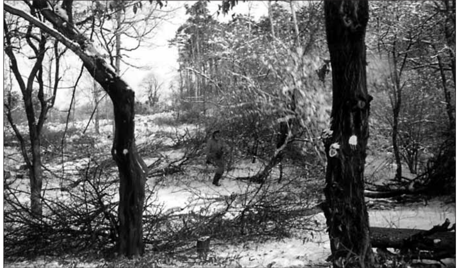
Obora dotváří vzhled našeho města, proto je třeba jejímu vzhledu věnovat pozornost