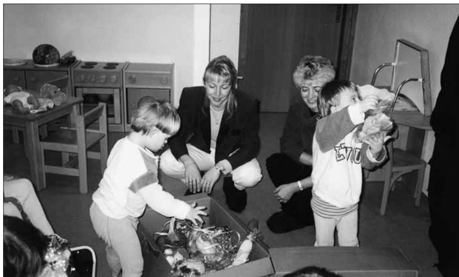
O děti v Dětském domově Lila v Otnicích je dobře postaráno.