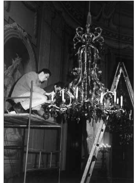
Vojáci na civilní službě čistí křišťálové lustry v Historickém sále.