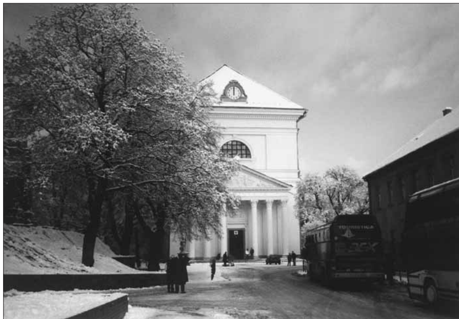
Už od rána posledního dne v roce proudily stovky lidí prohlédnout si zrekonstruované hodiny slavkovského kostela.