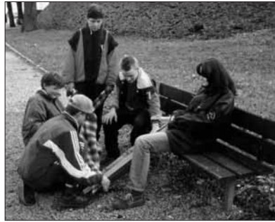
Vyzvědači plní vždy speciální úkoly, například pomáhají při ošetřování úrazů „náhodně“ zraněných občanů

Přeji vám, aby se ve vašem obličejí zrcadlila krása a spokojenost.