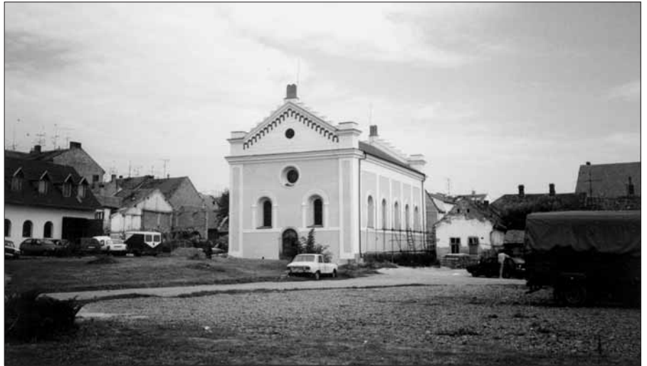
Koláčkovo náměstí těsně po opravě synagogy.

Popis sčítacích obvodů je uložen u vedoucí správního odboru MěÚ. Občan má právo, pokud projeví zájem, nahlédnout do sčítacích obvodů a zjistit si, který z výše uvedených sčítacích komisařů v době stanovené pro předávání tiskopisů ke sčítání a přebírání vyplněných sčítacích tiskopisů jeho domácnost navštíví. (MÚ)