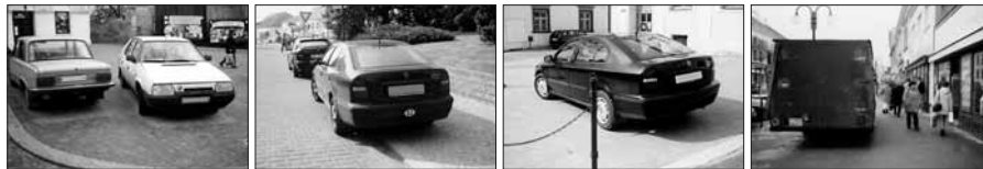
Parkování na chodnících je nešvar, se kterým se můžeme denně v našem městě setkávat. Častější kontroly policistů a ukládané pokuty snad tento problém vyřeší.

Odbor investic a dopravy MěÚ Slavkov u Brna