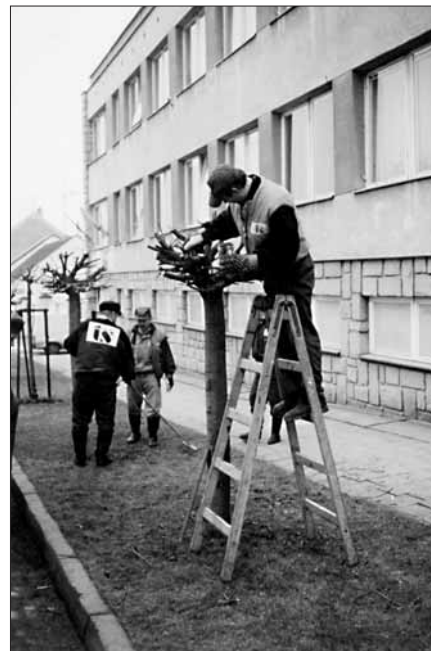
O veřejnou zezeň se vzorně starají pracovníci Technických služeb