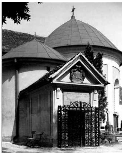
Kostelík sv. Jana Křtitele