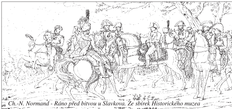
Ch.-N. Normand - Ráno před bitvou u Slavkova. Ze sbírek Historického muzea