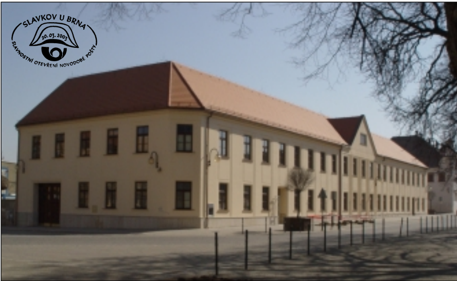
Novotou září opravená budovy pošty.