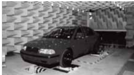
Akustické klíny LIKO-S v bezdozvukové komoře (Skoda, Mladá Boleslav)