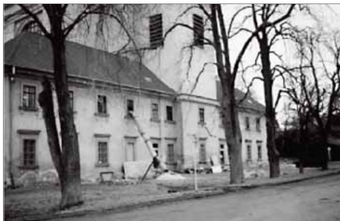
Práce na rekonstrukci kostela a fary již byly zahájeny