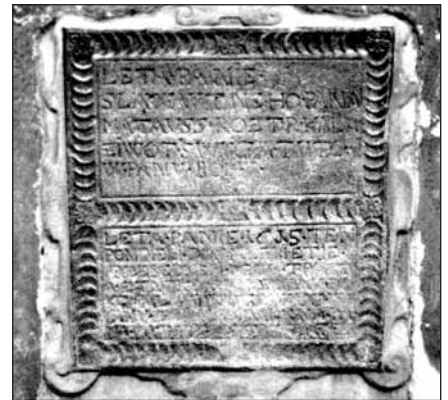
Náhrobek, který postavil sobě a své manželce Magdaléně Matouš Roztrkal