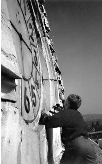
Demontáž hodin v r. 1996

M nozí z nás doteď žili Velikonocemi. Velikonočnímu pondělí u většiny z nás předcházela hloubkový úklid domu i jeho okolí. Umyla se okna, pověsily čisté záclony, „vyšmeždil“ se v domě každý koutek a vyhodily se nepotřebné věci. Správně před Velikonocemi konali junáci sběr železného šrotu, protože při předvelikonočním úklidu se najde mnohdy spousta nepotřebného kovu v garáži, dílně či v jiných prostorách domu.