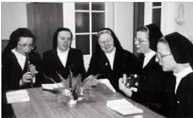
Ve chvílích pohody

Chudé školské sestry nejsou ve Slavkově žádní nováčci. Své kořeny zde zapustily už v roce 1883. Vedle tehdejší budovy kláštera na Tyršově ulici založily školu, školku a rodinnou školu, kde