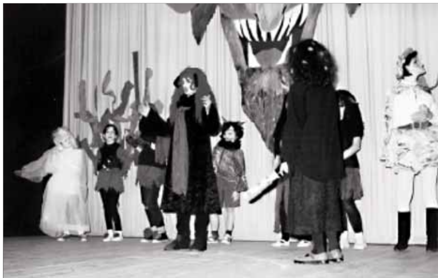
Malí herci hráli s chutí a diváci se určitě nenučili