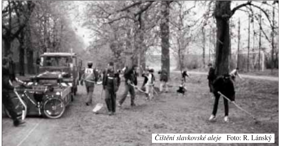
Čištění slavkovské aleje

Výstava Anatolije Ključinského potrvá do 19. září 1999, loutky si mohou návštěvníci prohlédnout až do 3. října. Výstava pohlednic a fotografií bude ukončena nejdříve, a to 9. května. Petra Janošíková