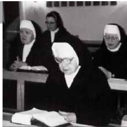
Řádové sestry při modlitbách v klášterní kapli

Slib poslušnosti, slib chudoby a čistoty. Umění žít ve společenství. To je podstata duchovního života. Po třech letech se skládají tyto první sliby. V průběhu dalších tří let si to dívka smí rozmyslet a z kláštera odejít. Po šesti letech následují tzv. věčné sliby a adeptka se tak stává duchovní sestrou. Sestra Vojtěcha zdůrazňuje, že dívka musí mít povolání shora a musí se v tomto svém povolání cítit vnitřně šťastná.