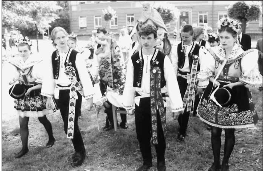
Slavkovští stárci se sochou sv. Urbana – patrona města.

J iž v podzimních měsících roku 1999 se začala pravidelně scházet skupinka mladých lidí, kteří se přihlásili k myšlence znovuoživení „Urbanských hodů“. Od mnoha slavkovských obyvatel zaznívaly pochybnosti: „Hody ve městě se nemohou vydařit, jde o přežitek minulosti, mladí vůbec neví do čeho jdou a skončí vše ostudou, akci se nepodaří finančně zajistit, ...“ S blížícím se termínem konání hodů přecházely obavy i na samotné organizátory. Obnovit tradici je totiž vždy obtížnější, než pokračovat v akci, která je v obci hluboce zakořeněna.