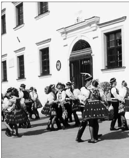
Stárci před radnicí