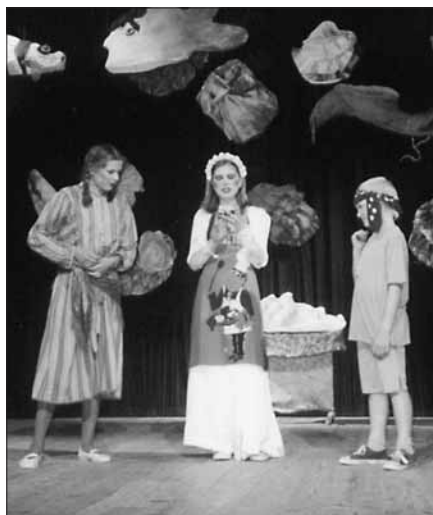
Divadelní představení Vlnobití se uskutečnilo na jevišti Společenského domu ve Slavkově

Ochoťnické divadlo je pro děti a mládež navíc skvělou volnočasovou aktivitou, která jim dává možnost uplatnění i mimo školu. HaF