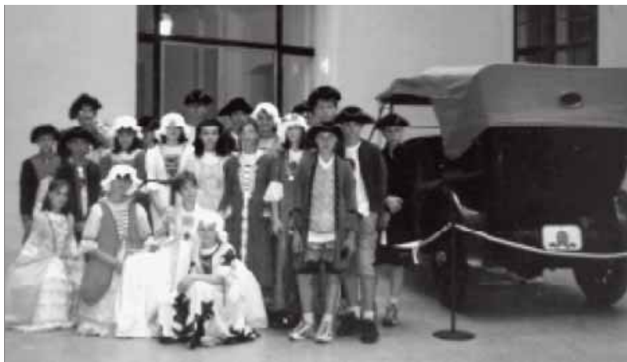
Žáci ze ZŠ Tyršova v historických kostýmech na nádvoří zámku Schönbrunn.