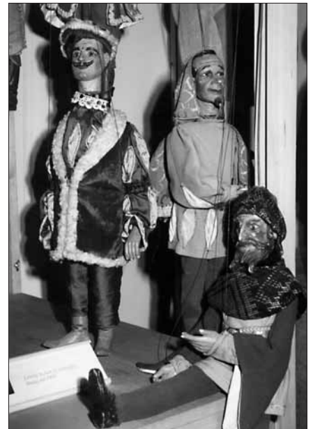
Do 3. října probíhá v severním křídle slavkovského zámku výstava Svět loutek, kde si návštěvníci zámku mohou prohlédnout více než dvě stovky loutek z dílny řady českých tvůrců a které zapůjčilo muzeum loutkářských kultur v Chrudimi