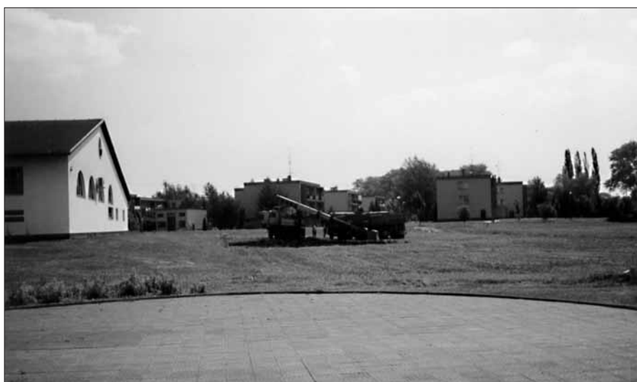
V lokalitě Polní budou stát městské byty

„Zastupitelstvo jsem informoval také o průběhu významných akcí ve městě, které se odehrály 4. května a 3. června za přítomnosti ministrů vlády ČR a zástupců NATO a přidružených zemí. Dále jsem informoval o uplatnění akcí Jihomoravské energetiky v rámci usnesení městského zastupitelstva z 24. května. Město