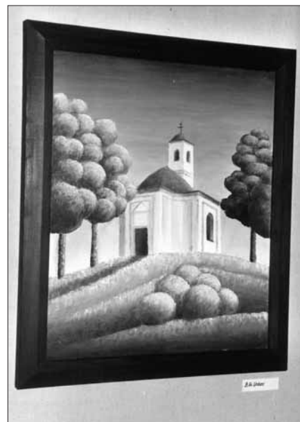
Z výstavy obrazů J. Škodáka.