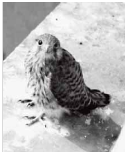
Stejně jako loni, i letos se na římse zámku usídlily dvě poštolky, které zde vyvedly svá mláďata. Poštolky plní nezastupitelnou roli při regulaci počtu holubů, jež svým trusem ničí památky

– informaci o stavu rekonstrukčních prací v objektu bývalé restaurace Bonapart a ukládá MěR vypovědět nájemní vztah s MVDr. Suchým