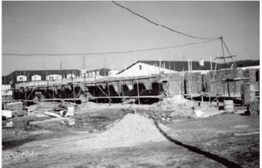
Stavba obecních bytů na Polní roste rychlým tempem. V současné době, po dokončení věnců prvního podlaží, se začíná na jižní straně již se stavbou druhého patra