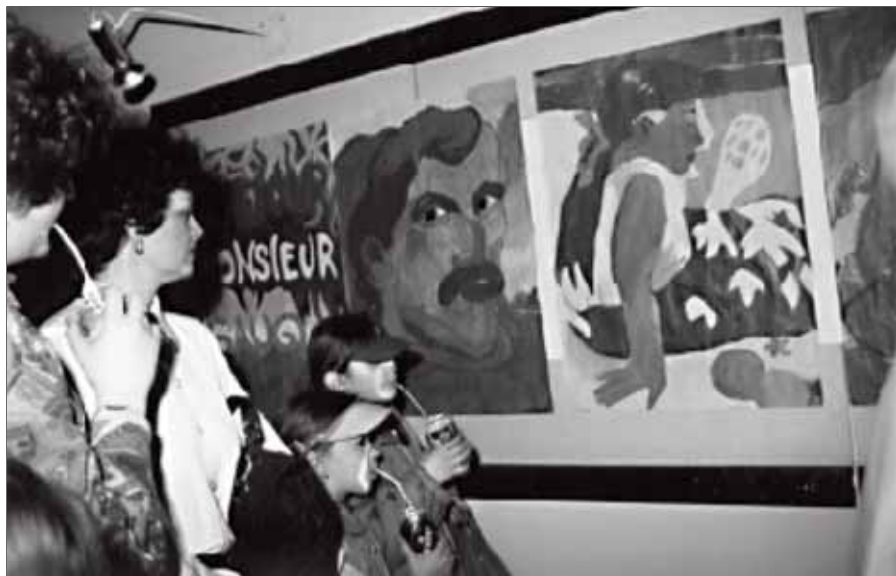
V galerii OK prezentují svou tvorbu nejen významní umělci, ale také žáci místní základní umělecké školy

Lidé, kteří si nedokáží představit svůj život bez nějakého kulturního vyžití, mohou být, co se týká výstav v našem městě, určitě spokojeni. Nacházejí se zde totiž hned dvě galerie.